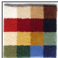
Les 16 coloris de la palette Flexiweave® - 2007/1

2°) A partir de ces 16 coloris nous pouvons quasiment lancer une fabrication immédiate pour n'importe quel dessin de moquette axminster.